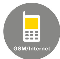
Report a ovládání